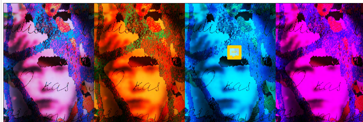
„Sibiro sielos“. Detalė „Vaikai“