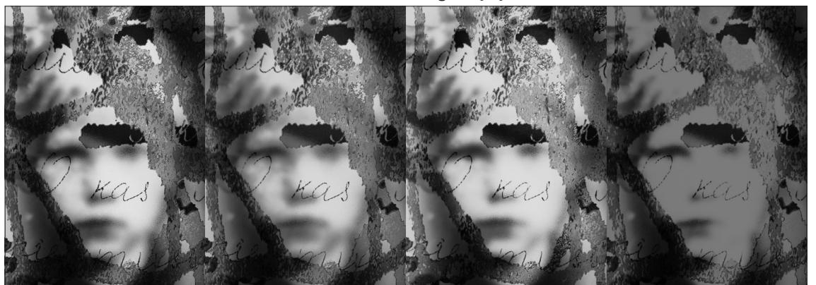
„Sibiro sielų“ serija. Vaikai.

menis: sąmonę, pasąmonę ir nesąmoningumą. Iš neuronų sudėtingumo atsiranda mūsų žodžiai, mintys ir sąmonė”, – dalijasi ilgamete mokslinė patirtimi menininkas. Taigi „Sibiro sielų“ serijos kūriniai suteikia stalinizmo laikotarpio aukoms nemirtingumą, įsiti-