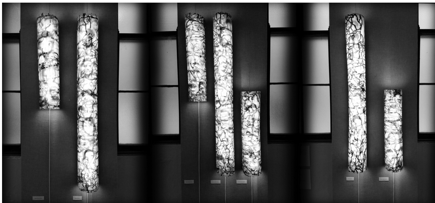
„Sibiro sielų“ šviesos skulptūros.